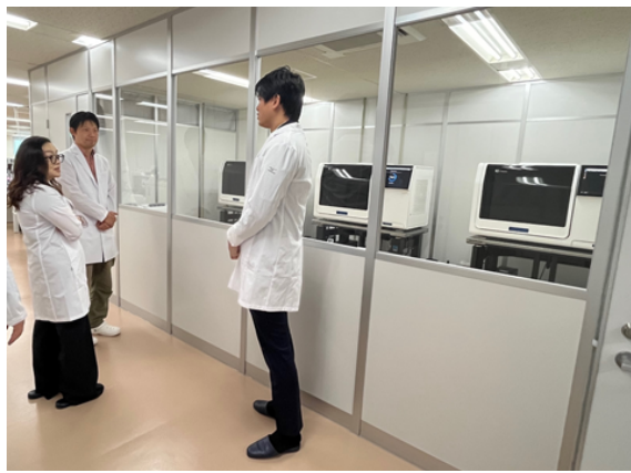
PSP 調印式後のラボツアーの様子